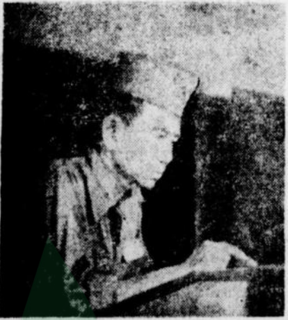
Dia dibelakang pemerintah

„Lebih dulu mesti orang2 Belan da keluar. Dalam kemelut di waktu ini kamu sokong Republik, dan itu bu baya kami tegaskan bahwa persatuan sangat perlu sekarang ini. Pada segala partai2 jang meng uruh ke kiri saja selamanya mend wak agar berdiri dibelakang Pem erintah.